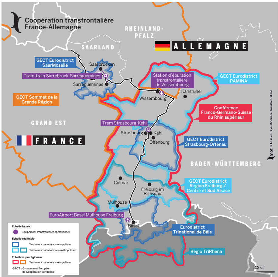
Figure 1 : Coopération transfrontalière entre la France et l'Allemagne / Source : Mission opérationnelle transfrontalière, http://www.espaces-transfrontaliers.org , (09.12.2021)

Depuis l'Accord intergouvernemental de Bonn de 1975 ( Deutsch-französische Konsultationen ), la frontière entre la France et l'Allemagne fait l'objet d'une coopération transfrontalière intensive. Cette coopération s'articule autour de deux Eurorégions qui seront analysées plus en détail : la région du Rhin supérieur dans le bassin du Rhin et la Grande Région dans le bassin formé par la Moselle et la Sarre (cf. figure 1).